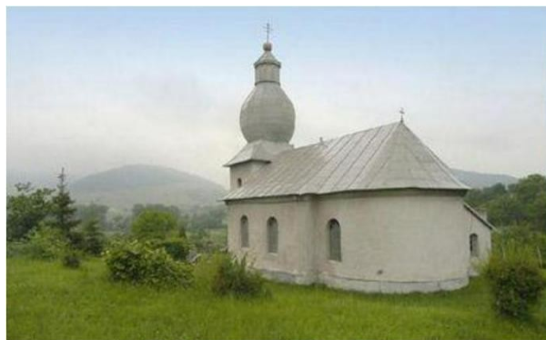
ĎURĎOŠ - Nanebovstúpenie Pána, 1781